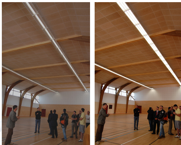
Salle de sport de Larchamp : Comparaison entre l'éclairage à un et à trois néons.

dépourvues de système de chauffage et mettent en avant l'optimisation de l'isolation. Le maître d'oeuvre met en avant plusieurs aspects autour de ces choix :