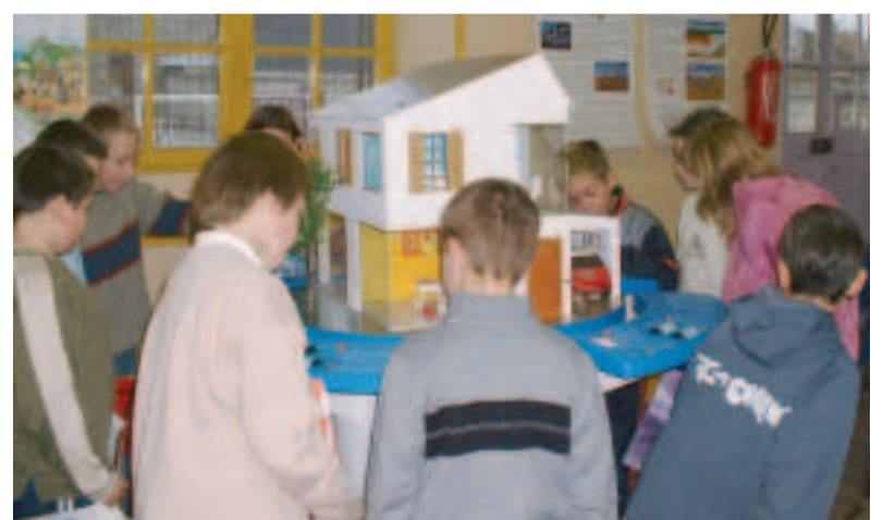
Petits et grands ont découvert la gestion de l'énergie grâce à une exposition à Commer.

Commer : en marche vers les économies d'énergie