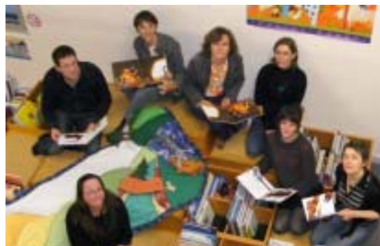
Avec « Croq'les mots, Marmot ! » les bibliothécaires intercommunaux font découvrir les livres dans les communes de Haute Mayenne