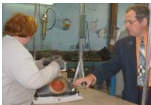
Un exemple : l'atelier démantèlement de déchets électriques de Maine-Atelier mêle environnement, rentabilité économique et insertion par le travail.

Pour encourager le développement économique et les initiatives des entreprises, les élus du Pays ont choisi d'appliquer dans le cadre de la candidature du Pays au prochain programme LEADER, le concept d'« économie durable ».