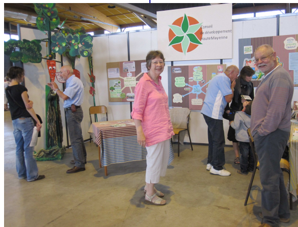
De nombreux contacts ont été noués en septembre sur notre stand à Fontaine-Daniel et à la fête des Associations de la CCPM (ci-dessus).

Depuis mai, les consultations se généralisent sur l'ensemble du territoire avec des structures ou des organisations comme le CER-France, Créavenir, le Club d'Entreprises.... Un questionnaire a été proposé par différents canaux et lors de rencontres : fête de la Terre à Fontaine-Daniel,