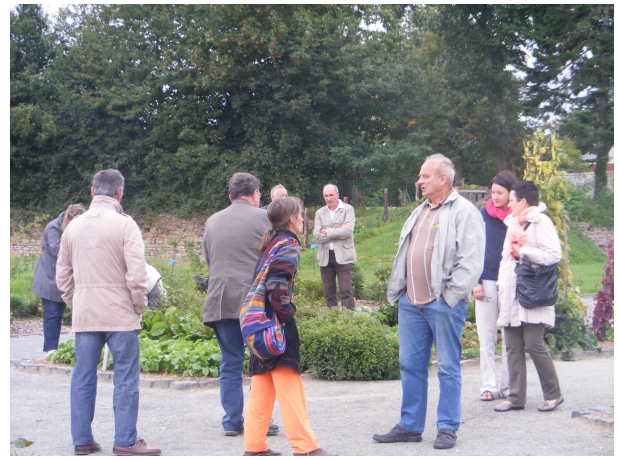
Visite du Jardin pédagogique intergénérationnel de Saint-Denis de Gastine, lors de la réunion « Bien vieillir en Haute Mayenne »,

Documentations disponibles (mémoire et rapport) au Conseil de Développement et sur son site Internet. ( www.hautemayenne.org/reseau/conseil_developpement.htm )